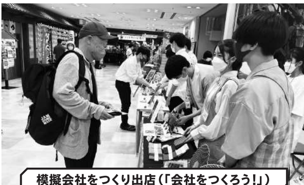
模擬会社をつくり出店(「会社をつくらう!」)