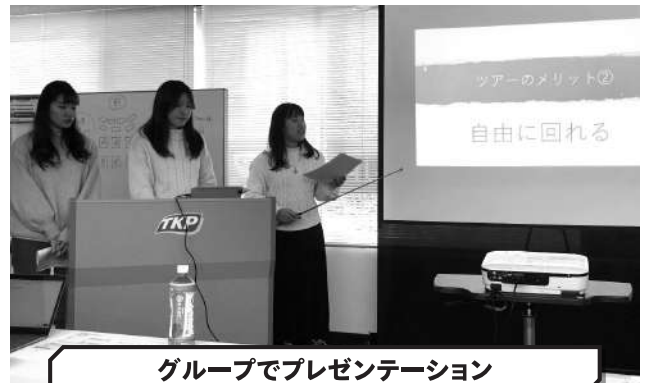
グループでプレゼンテーション