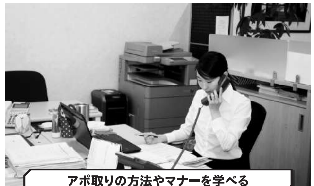
アポ取りの方法やマナーを学べる