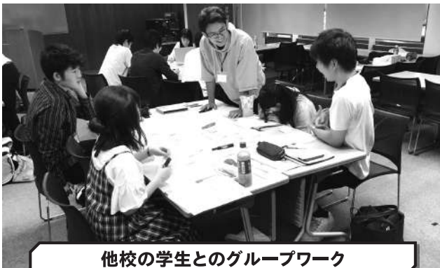
他校の学生とのグループワーク